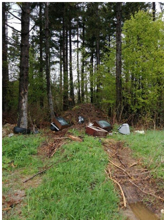
Slike na lokaciji Vrata - Plasa na dijelu katastarske čestice 1031/4 i 6922 u k.o. Vrata