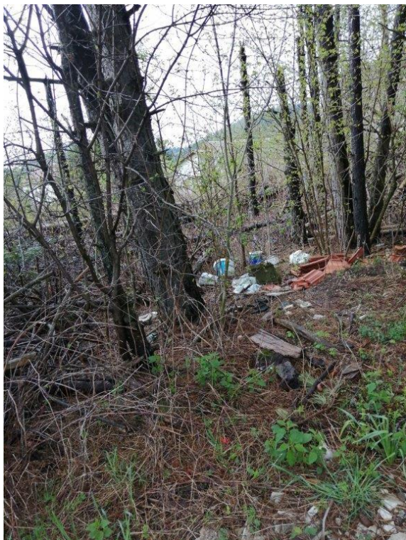
Slike na lokaciji u Ulici Vrata na k.č. 1334 k.o. Vrata